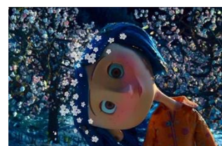
Кадры-эмоции из мультфильма «Коралина с Стране Кошмаров», США, 2009 г.