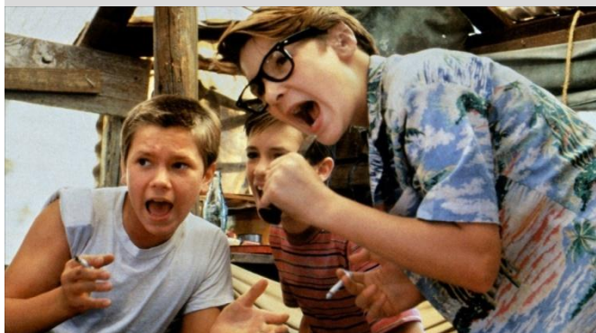
Кадры из фильма «Останься со мной», 1986 г. (США)

Во-вторых, данный период в жизни людей сопровождается разными эмоциональными проявлениями: протестами, подавленным настроением, повышенной эмоциональностью. Это вызывает трудности в жизни подростка и может приводить к конфликтам со сверстниками.